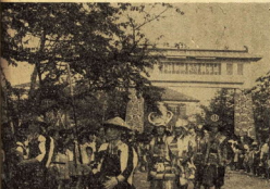
時代風俗行列(水の公園入口)