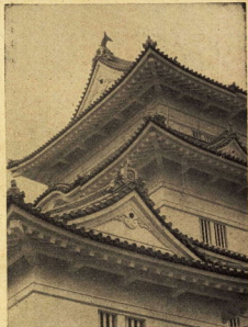
手前は絞帯(つっきやぐら)