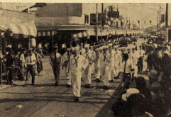
米海軍楽隊の市中行進