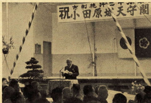
完成祝賀式における市長の式辞