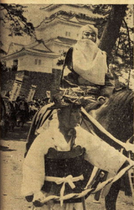
時代風俗行列における北条早雲