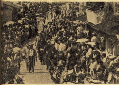
時代風俗行幸(参観者で埋まる箱根口)

各階の紹介 第一階 観覧(観覧券500円) 第二階 観覧(観覧券500円) 第三階 観覧(観覧券500円) 第四階 観覧(観覧券500円) 第五階 観覧(観覧券500円) 第六階 観覧(観覧券500円) 第七階 観覧(観覧券500円) 第八階 観覧(観覧券500円) 第九階 観覧(観覧券500円) 第十階 観覧(観覧券500円)