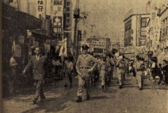
米陸軍楽隊の市中行進