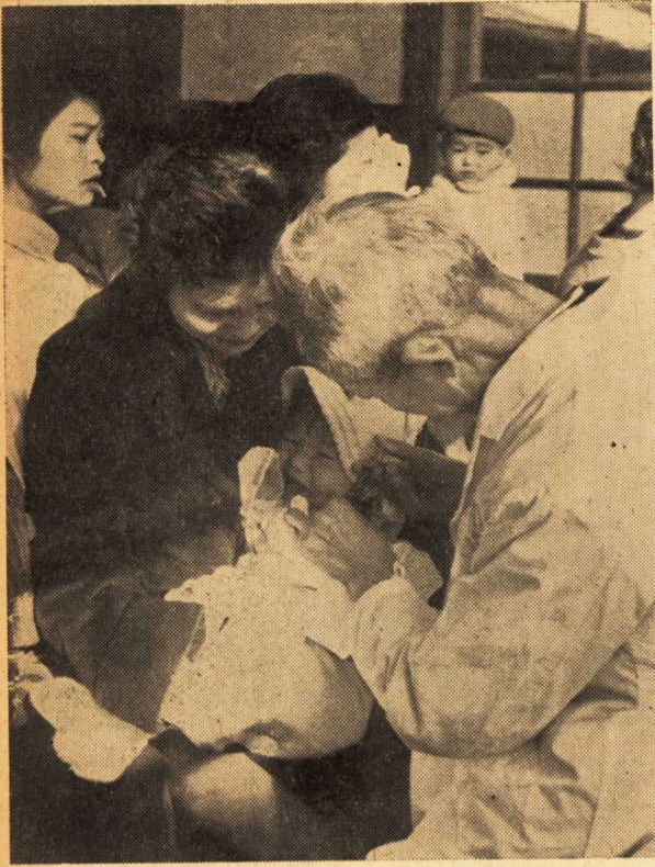
本町小学校における小児マヒの予防接種

このため政府では、三十六年度中学生の増加に対処するため、市中に教室の整備をはかるよう、臨時措置法を公布し、三十六、三十七年度の各中学校の増築と、城南中学校の新築工事を急ピッチで進め