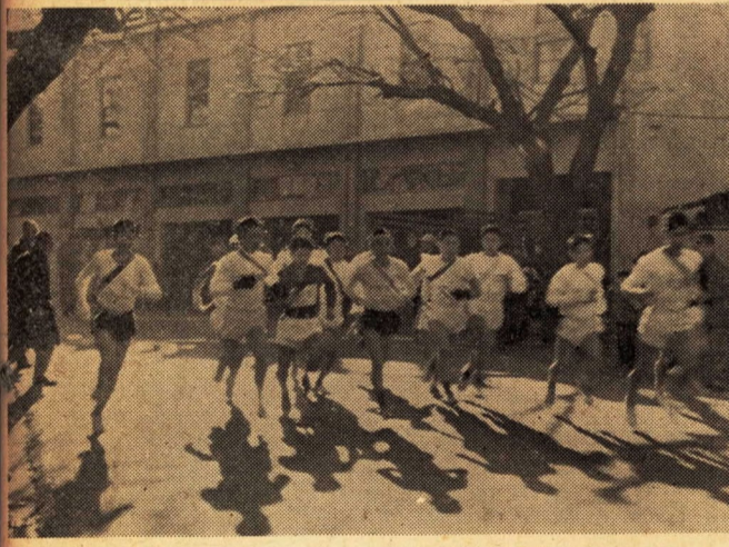
市一周駅伝のスタート(江之浦農協前)

東海道新幹線工事は着々進められ、本市の新駅設置も具体化されることになったのであります。この陸上交通における画期的気運にあわせて、海上の交通においても小田原漁港、いよいよ外港と内港とを連結させる工事の運びとなり、たまたま交通の要衝に位置する本市に、さらに飛躍的な新生面を開くことになりました。 このような情勢に備えて道路、橋りよう、上下水道等の建設事業並びに尿じんか処理施設もその建設が行なわれ、コンポスト工場は新春には完全操業をなすに近づいております。さらに二十周年記念事業としての市民会館の建設工事が、いよいよ新築工事から開始されます。