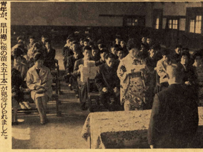
大窪地区の成人式