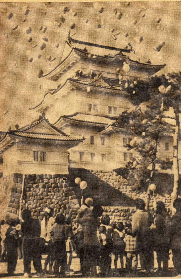
田原城天守閣広場で二十三区子供...