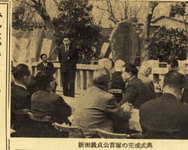
新田義貞公首塚の完成式典