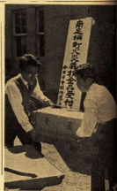
先生と一緒に楽しむ給食のりとと

南無のり児童に 南無のり児童会が、児童たちに現金と衣類などを贈った。これは、児童たちの生活に役立つものである。