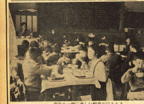
先生と一緒に楽しむ給食のりとと

学校給食費を値上げ 一カ月三〇円に 本市の学校給食費が、五月十日現在、一カ月三〇円に値上げされた。これは、食料品の値上げと、燃料費の増加によるものである。