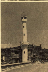
写真は四分之三の建設工事

五月一日のこどもの日が近づいて来れば、こどもは、何をどうしてやらなければならないか、と、親や教師に悩まされることが多い。こどもは、親や教師の言うことを聞き、それを実行する。こどもは、親や教師の言うことを聞き、それを実行する。こどもは、親や教師の言うことを聞き、それを実行する。 こどもは、親や教師の言うことを聞き、それを実行する。こどもは、親や教師の言うことを聞き、それを実行する。こどもは、親や教師の言うことを聞き、それを実行する。