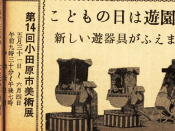
こどもの日は遊園地へ 新しい遊器具がふえました

第14回小田原市美術展 五月二十日から六月四日まで開催。彫刻、絵画、工芸品の展示が行われる。