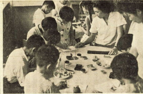
写真は預金を集計する下府中ことも協同組員