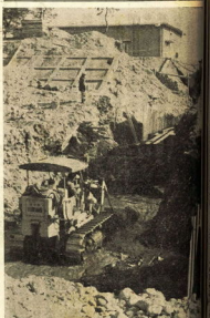
第三水源工事現場 酒匂川河床に集水管理設

第三水源工事の急ピッチで進められている。市は、この地区を「連絡街路」の中心として、市街地を再編成する計画を立てている。この計画は、昭和三十七年度の概算事業に盛り込まれ、三月三日の市議会での議決を経て、三月下旬に着手する予定である。