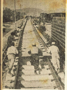
国鉄新幹線モデル線区稲宮付近における軌道敷設

総合施策を推進 新市建設計画。総合施策を推進 新市建設計画。総合施策を推進 新市建設計画。 総合施策を推進 新市建設計画。総合施策を推進 新市建設計画。総合施策を推進 新市建設計画。