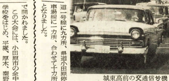
城東高前の交通信号機

かねて山王網一色及び国府津地区の方々が要望されていた交通信号機が、このほど城東高校前と国府津駅前両交差点に設置され、それぞれ六月二十八日から点灯をはじめました。