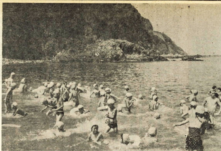
岩海岸で水泳の曾我小学校

市内小、中学校の夏季特別行事のトツプを切つて曾我小学校では七月二十一日から二十三日の日程により真鶴小学校で臨海学校を開きました。