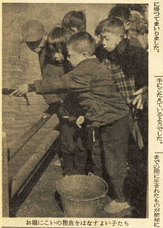
お堀にこいの稚魚をはなすよい子たち

県では、このほど小児マヒ予防対策の一環として生ワクチンの投与とソークワクチンによる予防接種の実施計画を定めました。生ワクチンは、実施日現在で生後三月から一年十一月までの乳幼児と、小学校四年生から中学校一年生までの希望者を対象として、三月中に1型及び2型の混合ワクチン3型ワクチンをそれぞれ無料で投与することになっております。一方ソークワクチンの接種は、一昨年から昨年から四月一日まで間に生まれたものが前年に引継ぎ最後の第三回目を、また昨年の四月一日から十月一日までの間に生まれたものが第一、二回目をそれぞれ四月上旬から受けることになっております。