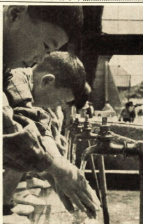
食卓の注意。食卓の注意は、食中毒の予防に重要である。清潔な環境での食事と適切な調理法を守ることが大切である。

手洗いの励行、飲食物の注意など。手洗いの励行は、感染症の予防に非常に効果的である。また、飲食物の注意も、食中毒の予防に重要である。清潔な環境での食事と適切な調理法を守ることが大切である。