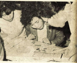
写真は人気を集めている成人学校鎌倉彫りの講座