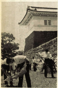
【写真(上)天守閣(右下)慰霊塔付近を清掃する相洋中・高校生】

城址公園など清掃 相洋中・高校生が美化運動 市内小の相洋中と、城西高校の生徒が、五、二十日の両日、天守閣、慰霊塔、山崎公園、城址公園など、市内の歴史公園を中心に、清掃活動を行った。相洋中は、城西高校の生徒と一緒に活動し、それぞれ担当の場所を清掃した。城西高校は、市内の歴史公園を中心に、清掃活動を行った。城西高校は、市内の歴史公園を中心に、清掃活動を行った。