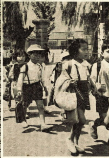
集団で下校する 国府津小の児童

集団下校、児童の安全を確保するため、各小中学校で励行されている。児童の誘かいに注意し、集団での下校を奨励している。児童の安全を確保するため、各小中学校で励行されている。児童の誘かいに注意し、集団での下校を奨励している。