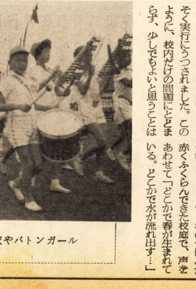
運動会で活やくする鼓笛隊やパトンガール

私たちの学校生活 その12 国府津小学校 私たちの学校生活 その12 国府津小学校