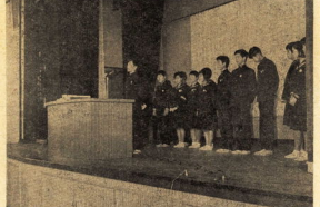
生徒会新役員のあいさつ

第17回市一周駅伝 富水チームは、今年も市一周駅伝で連続優勝を果たしました。これは、チームの団結と選手たちの努力の賜です。