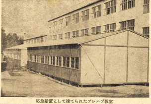
応急措置として建てられたプレハブ教室

一月廿七日午後五時五十分、白山中の校舎が火災に見舞われ、全焼した。幸い、生徒や教職員は全員無事であった。焼けた校舎は、プレハブ教室に移り、二月一日から授業を開始した。この間、市民の協力により、プレハブ教室の整備や、生徒の生活支援が行われた。また、火災の原因は、校舎内の電気配線の不備によるものと見られる。今後の対策として、校舎の老朽化対策や、防火設備の充実が求められる。