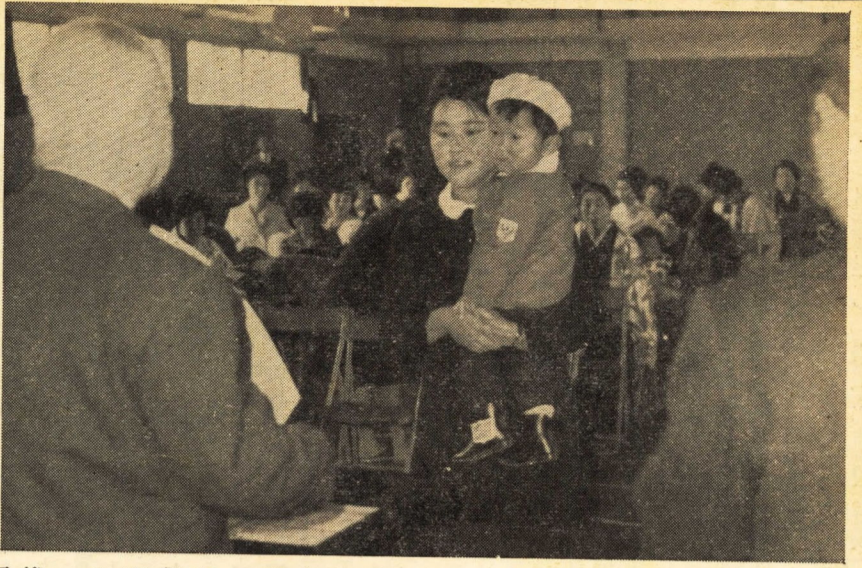
表彰される赤ちゃんとそのおあさん