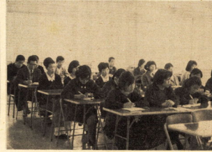
職業意識を高める店員さん