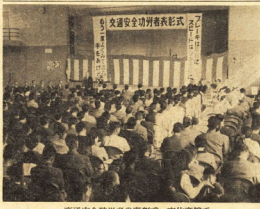
交通安全功労者表彰式の長編式・市体育館前で

功労者など表彰。秋の交通安全運動旬間に。功労者など表彰。秋の交通安全運動旬間に。功労者など表彰。秋の交通安全運動旬間に。