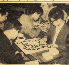
人気のあつまる囲碁講座