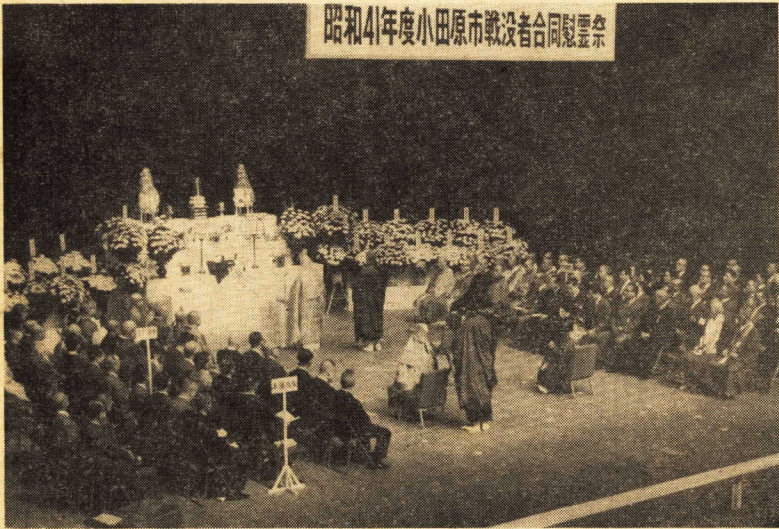
昭和41年度小田原市戦没者合同慰霊祭

小田原市の推計人口 10月1日現在 人口 146,158人 男 72,246人 女 73,912人 世帯 34,547世帯 人口増 159人 人口減 89人 人口比 70人 前月と比 増59世帯