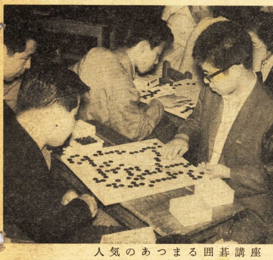
人気のあつまる碁講座

第七回読書ノートコンクール表彰式 ことしは、ついに応募者が小中学生あわせて二千六百六十一名に達しました。そのうち各学年につき優秀3編、計27編、優良5編、計45編、佳作10編、計90編の入選を決め、優秀・優良者の表彰式を行なうものです。 11月12日(土) 午後1時30分 分科別表彰式。 11月19日(土) 午後1時30分 2階小劇場。