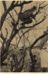
梅の手入れの様子

梅の開花は、冬を告げる大切な行事です。梅の手入れは、健康で安全に行うことができます。梅の手入れは、健康で安全に行うことができます。梅の手入れは、健康で安全に行うことができます。