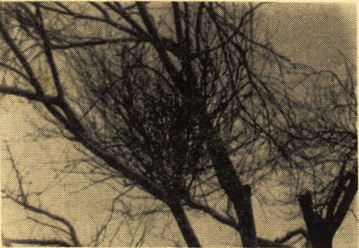
この病を植木屋さんが

それは、この桜のテングス病とは、どんな病気かといいます。それは、この桜が、すこし太い木ではあちこちの枝が、ちよと竹ぼうきをさかさにしたなかの葉のようになつてきます。そして花の咲く時期になつても葉ははらけで、そのうえ弱な枝がいつぱいに伸び、ひどくなると木を枯らしてしまつてしまいます。病原菌はカビの一種で、暖かくなると風に乗ってカビの粉を飛ばし、どんどん病気をやがります。