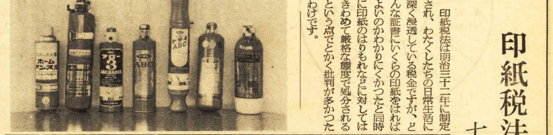
【写真は】 粉末小型消火器

家試験に合格した消防設備士の免許を持つておられます。消火器は、だれでも取り扱えるように、簡単な構造でできているので、万一事故のときに、なかなか正しい使い方ができないことが多いのが、役取り扱いの練習を行つて、消火器の機能を、十分に發揮できるようにしていただきます。