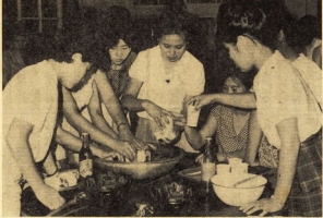
前田行なわれた成人学校講座のひとつ「調理」

余暇を有効に活用し、知識・技術を身に付けたい方、資格取得を目指す方、社会生活に役立つ知識を身につけたい方、など、お気軽に入学してください。 募集期間：9月10日～19日 入学式：9月24・25日 校舎：小田原市立総合体育館