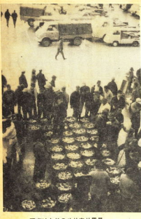
写真はあじのせり売り風景

一昨年八月川川の由緒長い小田原魚市場が、この春の再開を期して、三月二十七日(土)に正式に業務を開始した。再開を期して、三月二十七日(土)に正式に業務を開始した。 再開を期して、三月二十七日(土)に正式に業務を開始した。再開を期して、三月二十七日(土)に正式に業務を開始した。