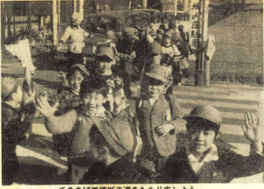
手をあげて横断歩道をわたりましょう

春の訪れとともに、子供達の事故も増加傾向にある。特に、横断歩道を渡る際の不注意による事故が目立つ。適切な交通指導を行うことが、子供の安全を守る鍵となる。 警察庁の調査によると、今年1～3月の間に、小学生の交通事故は前年同期比で15%増加した。そのうち、横断歩道を渡る際の事故が全体の約40%を占めた。これは、子供達が横断歩道を渡る際に、手を上げて歩行者であることを知らせるという指導が徹底されていないことが原因と見られる。 また、春は桜の開花時期であり、子供達が公園や公園周辺を遊ぶ機会が増える。この時期には、公園内での遊具の故障や、公園周辺の道路での事故も増加する傾向がある。公園管理者や保護者は、遊具の点検や、公園周辺の交通規制を厳格に行う必要がある。 子供達の安全を守るためには、学校や家庭での交通安全教育が不可欠である。特に、横断歩道を渡る際の「手を上げて渡る」という指導を徹底させることが重要である。また、保護者は、子供が通学路や公園に行く際に、必ず付き添い、安全を確認する必要がある。