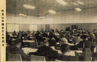
写真は市議会3月定例会

交通事故は、加入者の家族や知人、友人、近所の人など、多くの人々を巻き込んでおこります。交通事故は、加入者の家族や知人、友人、近所の人など、多くの人々を巻き込んでおこります。交通事故は、加入者の家族や知人、友人、近所の人など、多くの人々を巻き込んでおこります。