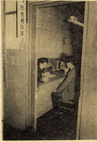
写真は開設された市民相談室

交通災害共済は、わたがわらを通じて、加入者が急増し、現在44,265名に達しています。これは、昭和43年4月30日現在の数字です。加入者は、昭和42年4月30日現在に比べて、約10%増加しています。これは、交通災害共済の重要性が広く認識され、加入者が急増していることを示しています。 加入者は、昭和42年4月30日現在に比べて、約10%増加しています。これは、交通災害共済の重要性が広く認識され、加入者が急増していることを示しています。