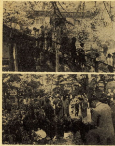
にぎわった天守閣と植木市

本市消費生活モニター調査の結果、消費者が最もよく利用している店舗は、一般小売店が66.5%を占めた。これは前年調査の結果とほぼ同様の傾向を示している。