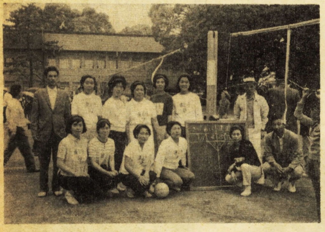
平均年齢32歳の蓮正寺婦人バレー部員