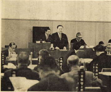
市議会 6月定例会本会議

小田原市の推計人口 6月1日現在 人 158,968人 男 78,471人 女 77,497人 出生者 36,335人 死亡者 22,136人 人口増 14,199人 前月の比較 男 女 人口増 の比較 57位増