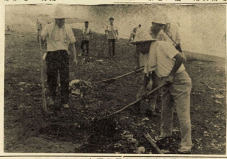
早朝の清掃奉仕 おとしよりに感謝 福祉週間に多彩な行事

臨時会の議事内容は、市議会議員による議決が行われ、重要な事項が決定された。臨時会では、市議会議員による議決が行われ、重要な事項が決定された。