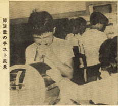
脚活量のテスト風景

「箱根の自然をテーマに」 講師 箱根高等学校 開催日時 11月22日(日) 午後1時～4時