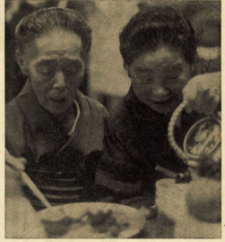
「ごちそうのあとのお茶は特別