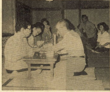
健康測定をする保健婦

「保健婦は、現在保健婦が、町民の健康を守るために、日々活動しています。町民の健康を守るために、日々活動しています。町民の健康を守るために、日々活動しています。」 一、健康講座 二、健康相談 三、健康測定 四、健康測定をする保健婦