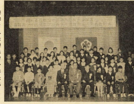
表彰された優良青少年たち

文化の日市民会館で、優良青少年の表彰式が行われた。表彰されたのは、学業、スポーツ、社会活動などで顕著な成績を挙げた青少年であり、その功績を高く評価している。