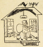
消防本部、消防署、消防団

火事をなくしあかるいお正月を迎えましょう。 ・たばこの投げ捨てを避けましょう ・おやすみ前お出かけの前にもう一度火元を確認しましょう