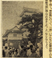
天守閣を眼下に小さく消えて

市民児童遊園会は、昨年の夢をもちまして、今年も正月三日(月)の夜、天守閣を眼下に小さく消え、空高く……風船だよりを飛ばすことになりました。当日は、朝早くから大勢の人々が集まり、風船の準備がはじまりました。風船は、市民児童遊園会が用意したもので、子供たちが夢をいっぱいさせて飛ばすことになりました。当日は、朝早くから大勢の人々が集まり、風船の準備がはじまりました。風船は、市民児童遊園会が用意したもので、子供たちが夢をいっぱいさせて飛ばすことになりました。