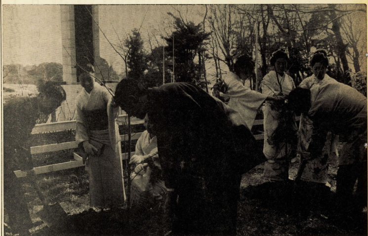
万年地区成人による記念植樹（小峰にて）