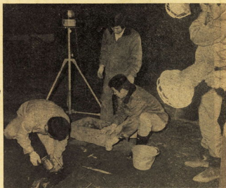
▲ 交通標識、ライトも準備した漏水修理の現場