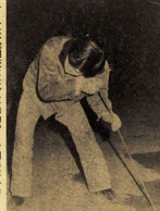
▶ 漏水検知器には、最初でも調子が悪く一着