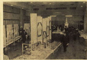
市民会館の菓子展示会場

「おやつコーナー」は、市民会館で開催されている。展示品は、お菓子、パン、ケーキなど、種類豊富で、人気を集めている。また、お菓子の作り方や、お菓子の歴史など、興味深い展示もされている。