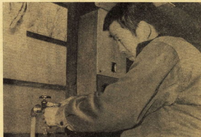
▲ がぜん多いじゃちの騒音