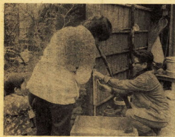
▲ 露出管保護も欠かせぬ常設対策

市民生活に欠かせない水。その水を守る使命感がなければ、このつらい仕事はできない。今日も明日も漏水を追って暮らすのだ。