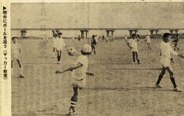
▶激戦にボールを奪うサッカー教室