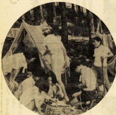
▲林間のキャンプ生活 (青少年の家)

くる日もくる日と真白な太陽とさらさら舞く太陽の下で、夏休み前からの盛り沢山な計画は次々に消化された。本校教室やサッカー教室の特別にも触れたい、サイクリング教室のバツテストにも記録が出た。 緑陰図書館では、地区の仲間二日のんびり本を読んだり、ゲームをしたり。 強い風がこごごよった時、時季少年の夏で、はじめてつくったカレーのうまか。こと、夜更の風がきれい。こと、 真真に日焼して、楽しんで、四十日間が過ぎ去る。こと、どの子も、どの子も思い出がたくてなつかしい。