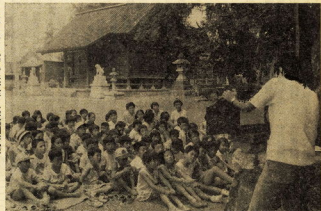
▶楽しいおかげで紙芝居(図画図工)