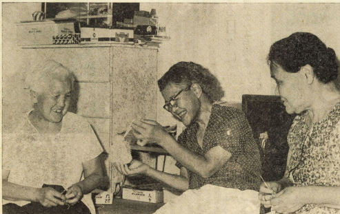
老後の幸せをだれもが見出しせるように

そこで、9月15日の「敬老の日」からはじまる老人福祉週間を前に本市における老人の現状とその対策を調査し、これらに対する理解を深めていただくとともに敬老の日の週間行事として終わらぬよう、そしてすべての人が避けられない「老後」を身近な問題として十分考えていただきたいものです。