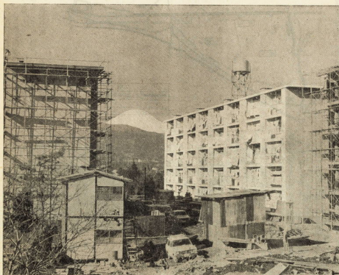
蟹田に建設中の中層耐火構造5階建の市営住宅