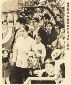
▲道端も遊具の箱は長い行列

桜のたよりが西の方から日々と東へ下がりつてくると、長かった安曇と別れ、春が訪れる。たれが寒から開放され、休みの日などは家族サービスも兼ねた道で、観光地へ入る人、ましてや、桜が咲いたとなれば花見の家が日本人の常。 小田原と桜寄りの期間中に準備を揃えて、四月二日の日曜日はおよそ十万人の出。天守閣周辺は、くり出し人と車でまきながら通ラッショ並み。 花の下では、飲むほどに酔うほどに踊りも飛び出ていますよ。歌。 このときはやはり、車若きと浮かれに浮かれて春を体中で満喫していました。