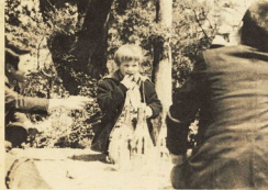
♪芽かたれて園児観察中