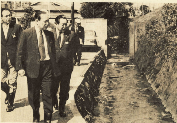
4月3日に行なわれた市長パトロール