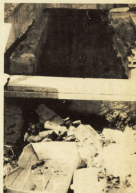
よどみにたまる廃物

市長は、この問題を解決するために、市民の協力を呼びかけ、河川浄化運動を展開しています。市長は、この問題を解決するために、市民の協力を呼びかけ、河川浄化運動を展開しています。