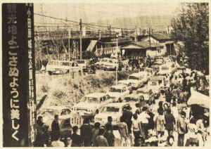
▲どこも人と車でうまる