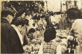
▲福本市も開かれて