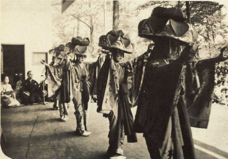
蛇皮線にのせておどる沖繩舞踊

快晴に恵まれたお城まつりの大名行列は、ことしもいろいろ趣向が凝らされて演出効果は満点。今回から新たに加わったものも多く、商店街連盟の人たちがふんする「城下町の町人風俗」などは、なかなかの名演技でささく浴道に声援がとぶ。なかでも、本土復帰を前に参加した沖繩舞踊は、まことにタイミングがよく、観衆は拍手大かっさい。子どもたちには、怪獣ブームのついでに怪獣とウルトラセブン登場となれば、正義の味方も逃げ出すほどの熱狂ぶり。八年目を迎えた大名行列は、すっかり板についてますます盛ん。