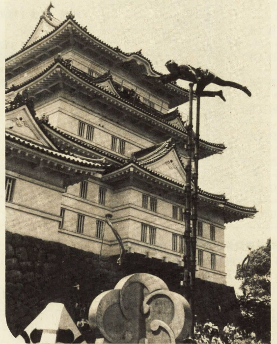
見事なはしご乗りの演技