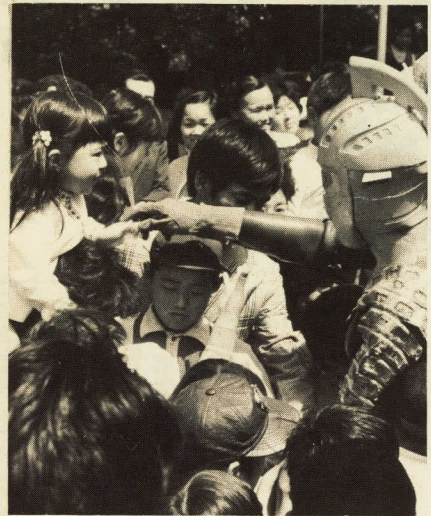
ウルトラマンは握手せ