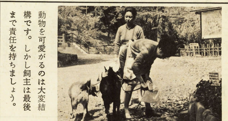
…城址公園をイヌのフンで汚さないで…