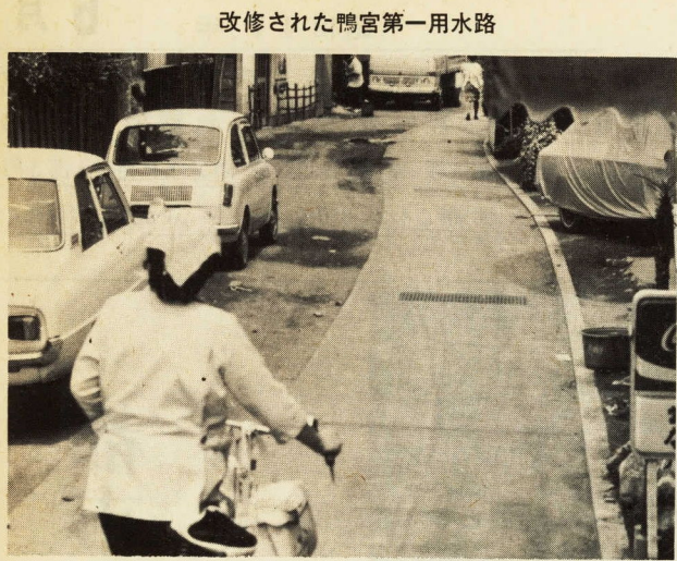
改修された鴨宮第一用水路

また、この水路については、関係者の全面的な協力によつて見違えるような水路が完成いたしました。今後このようなことが起きないようにしたいものです。 市内の水路はほとんど土揚敷があるもので、その境界が不明確な場合やこれらの官地を使用したい場合は、必ず事前に許可を受けるようにしてください。 このような事は土木課の境界査定係が専門に担当しており、みなさんからの申請がありますと、直接現地に出向いて処理に当たっておりますので、用のかたはお気軽(いつでも)相談にお出かけください。