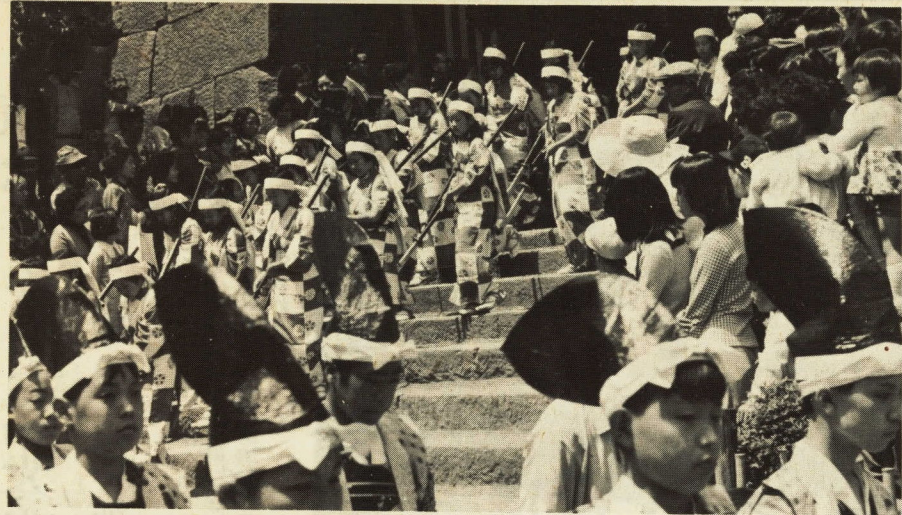
少年少女隊は人気のま