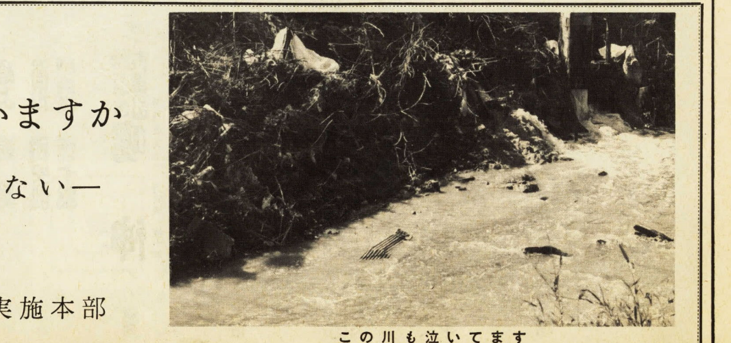
この川も泣いています

あなたの近くの川に 魚は住んでいますか —ごみは捨てない・捨てさせない— 小田原市美化運動実施本部