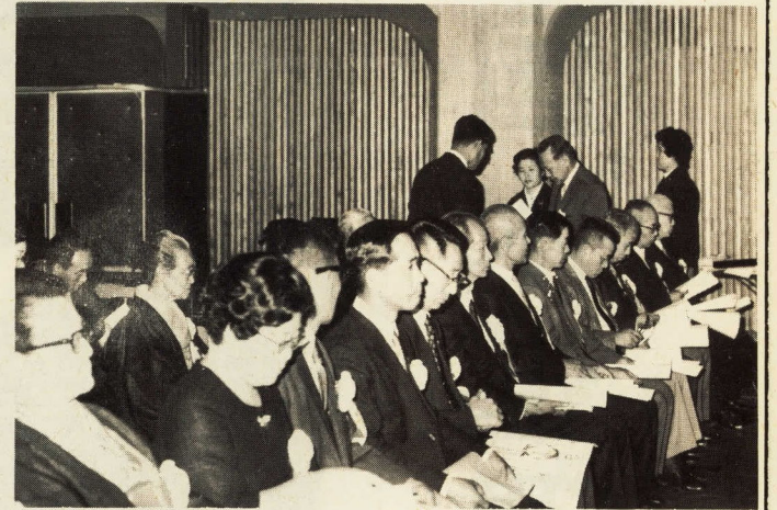
市長から表彰されるみなさん

なお、市内の納税貯蓄組合のうち特に納税組織確立のために組合員相互が一致協力し、優秀な成績をおさめた二十組合、二連合会が表彰されたのはじめ、本市税務行政および納税功労者ならびに十年以上の長い間組合長として、その職務を果されたかたがたに感謝状が贈られました。