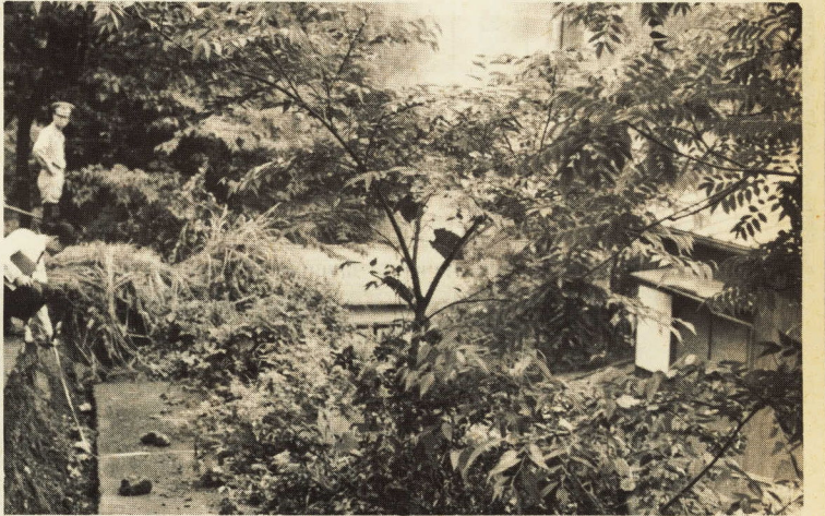
がけ下の家は注意が必要

◆ 浸水のおそれのあるところでは、浸水時にそなえて家財をあげる棚や台などを用意しておきましょう。 避難するときは、次のことに注意しましょう。 (一) 避難場所と安全な道順をよく覚えておくこと。 (二) 非常食糧としてかんづめ、インスタント食品などを用意するほか、懐中電灯、トランジスターラジオ、また医薬品などをわかりやすいところにそなえておくこと。