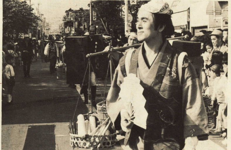
城下町の町人風俗