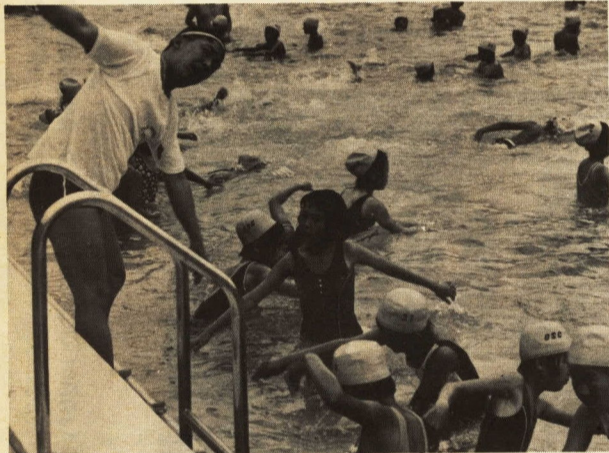
↑ 正しい呼吸の仕方をおぼえる