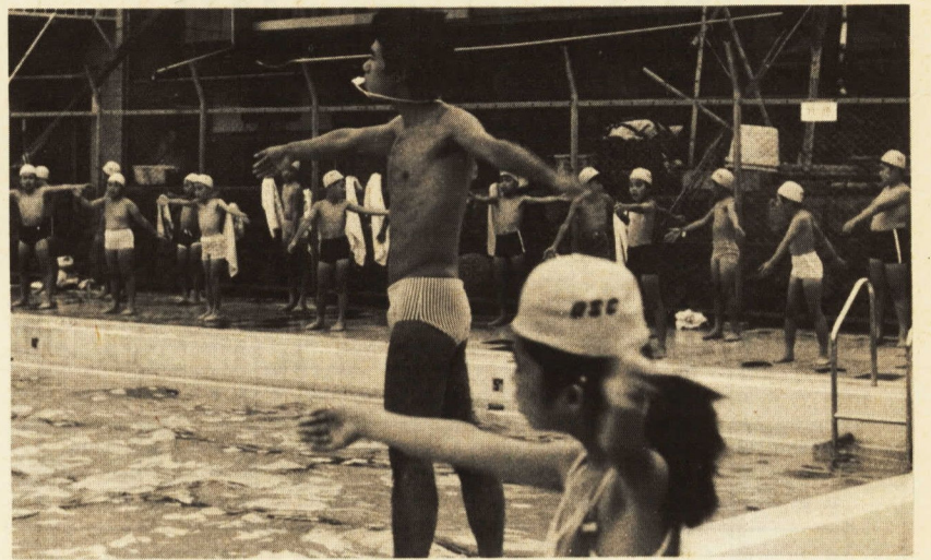
↑ 十分な準備運動を行なう