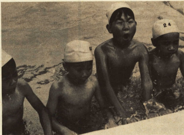
↑ 水を恐れぬよう頭まで水に入れる訓練