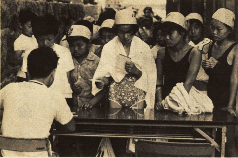
出席の確認を受ける