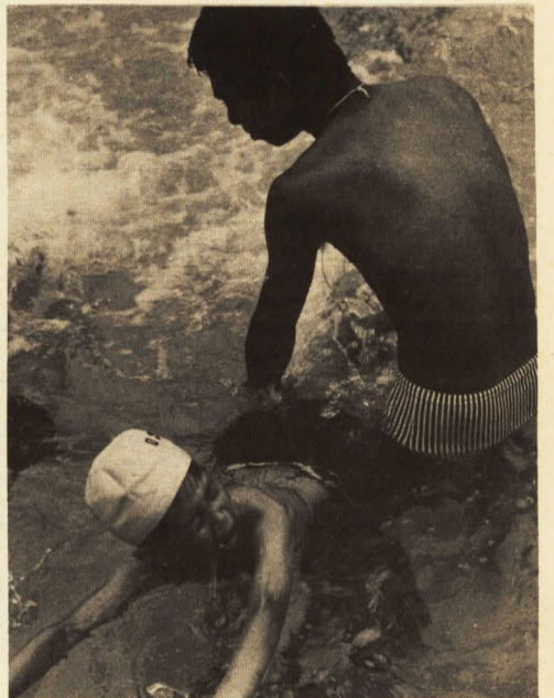
↑ 泳ぎの基本を教える

プールの無い小学校の子どもたちに泳ぎを教えるのが、初級の水泳教室。ことしも二百名が参加して、八日間コースが開催。 はじめは、水に顔を入れるのも恐れていた子どもたちが、教材が進むにつれてしだいに自信をもつ。 もともと子どもは覚えの早いもの、すいすいとはいかなくてもすぐに水しぶきを上げてかっぱの仲間入り。 全然泳げない子どもにも25メートル完泳を目的とするのがこの教室だが、最終日が近づくと50メートルも泳ぐ子がいるとはなかなかの成果あり。