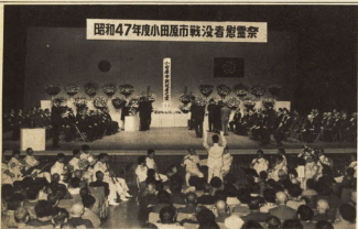
昭和47年度小田原市戦没者慰霊祭

神奈川県は、戦後復興、川崎の臨海地域を中心として、公害防止の対策を進めてきた。この公害防止の対策は、経済の発展をもたらした一方で、公害問題が大きな社会問題となつてきている。これに対し、県では、昨年、良好な環境の確保に関する基本条例の制定、および公害防止条例の全面改正をして公害に対処しています。このような時勢にあたり、各企業の方々が、公害防止の重要性を認識し、工場での公害防止について重点的をすすめることにより、公害防止に取り組む姿勢を確立して、いざという時のために、十一月二十日(水)～二十一日(木)までの三日間を「公害防止総点検の日」としましたので、各企業においては、企業自らが計画を立て、実施するようお願いいたします。