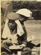
↑ こんなうまい昼飯いままにであつたかなー