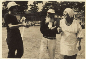
↑ ゆっくりに走ろう

明治・大正・昭和と激動の時代を生き抜いたパワーを示せば行なわれたのが、第一回小田原市老人体育祭。受付・放送・用具の係など分組も悪くなく、進行はいたってスムーズ。ブラスバンドを先頭に各地区入場行進にはじまり、全員体操でまさに気風入。 この大会、「ゆっくりに走ろう」が合言葉で、参加することには要がある。日ごろ子どもたちの喚声が聞えない校庭も、この日はかなりセアンを前に秋の日を浴びてお年寄りたちが終日とんだりはねたり。