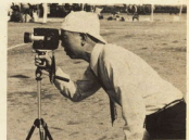
↑ わたしにも写せます