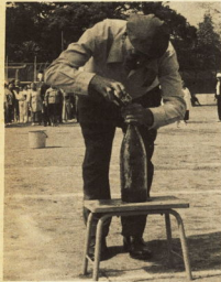
↑ ピンの入口広いようで狭い