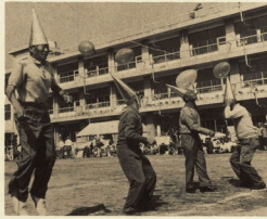
↑ 風船は帽子の針で割れるのです