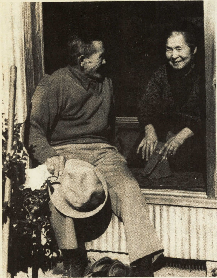
↑友愛訪問の老人相談員としてでなく隣人としての行為だ

人生の曲折を経てたどりつく晩年が、独りぐらしや寝たきりであったとしたらだれでも寂しいのが当り前。 この人たちのしあわせを考えるのが福祉行政だが、地域の人々の提携があつてこそ実を結ぶもの。 いま市内では九人の老人相談員が友愛訪問を続けているが、いっしょにお茶を飲み、話しをするだけでも笑顔が返ってくるという。 この善意、いまは小さな芽だけれど、いつか地域に友愛の花が広がってくれば、こんな願いをこめて今日も友愛訪問を続けるが、もし、いまあなたがしあわせならば、それを態度で示そうよ。