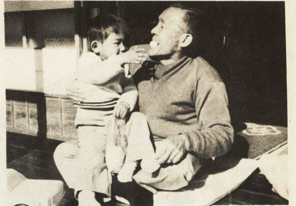
↑孫との語らいも大切な時間