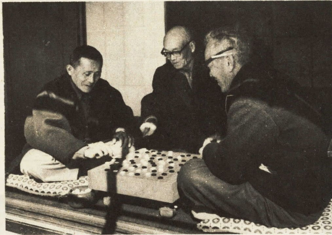
↑同世代の友人がいるのはよいものだ