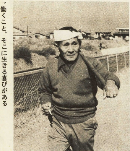
→働くこと、そこに生きる喜びがある