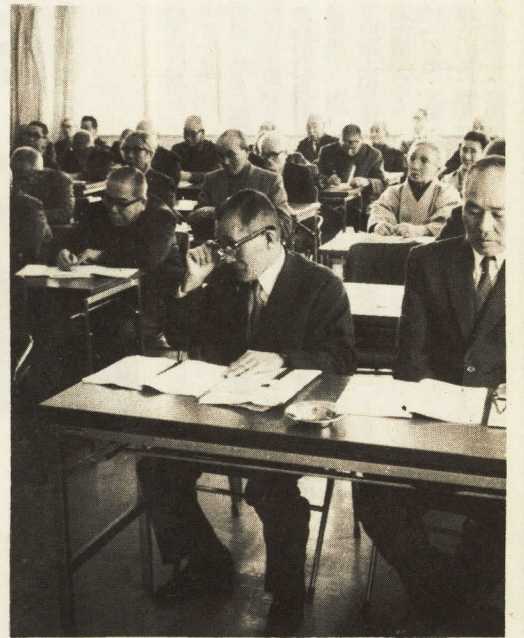
↑前向きの姿勢、それは終生学につながる