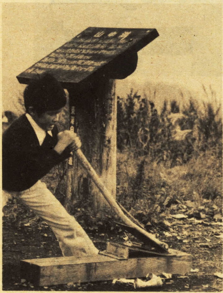
→空カンはつぶしてごみかごに

秋は絶好のハイキングシーズン。澄みわたった空の下、遠く連なる山々を眺め、深呼吸の二つもすれば、腹の中まで洗われるよう。すきをわけ、山路を進み、吹き出す汗も心地よく、五時間の行程はたっぶり歩いたというのが実感。 バス二台に分乗し、おもいおもしろい服装で参加した百人は、四歳から七十歳と幅広い。暮れゆく山中湖畔をあとにしたこの市民ハイキング、すでにこととして三十一回。