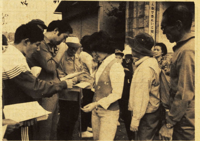
↑小田原駅前参加者確認