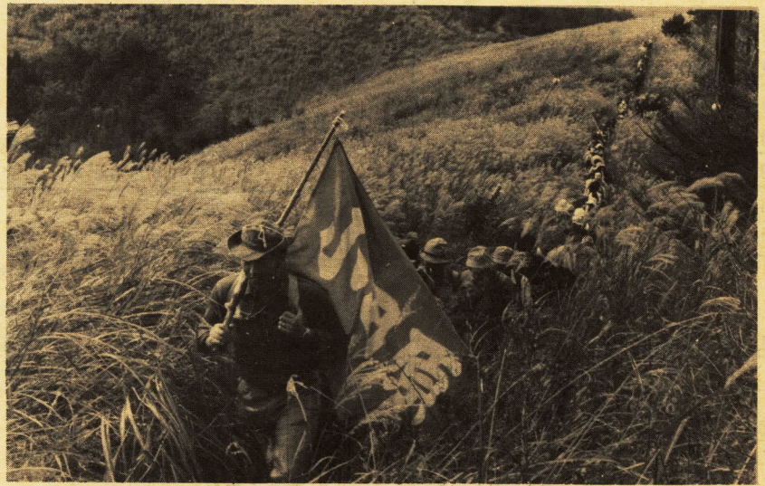
↑旗を先頭にすすきの原を行く