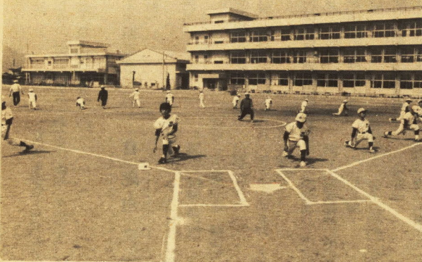
練習前の基本体操

昭和四十六年十月十七日結成。域に審判員と指導者を始め、われわれは「わたくしは何事にも努力し、小学校の先生方の熱心な協力もあって強い人になる」ことを誓い、スポーツを通じて、小学生ならざるや、リターとなって子どもが、スポーツを通じて、小学生ならざるや、リターとなって子どもが、仲間を重んじ、その目的を達成することを目的としました。 会員は、小学校四年生以上を募り、日頃スポーツを愛好する児童や、一方ではボールを握ったことのない児童に呼びかけました。体力づくりと技術的練習を重ね、四月七日の市予選もソフトボール大会にはこの中から選手をおく、まきかと思っていた無欲の優勝を果たしました。 四十七年四月十八日、四十八年四月十八日、四十九年三月二十三日、五十名、増減こそあれ、幸い地