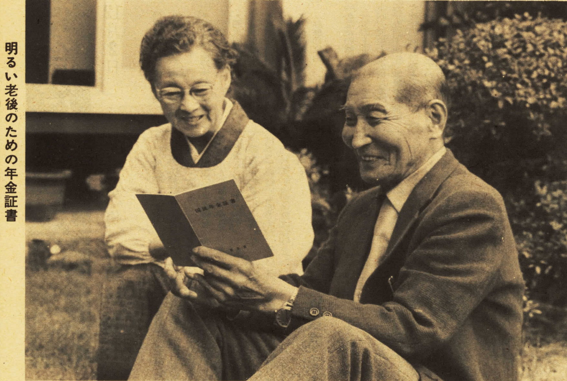
明るい老後のための年金証書

福祉年金は、年金の全額を国が負担し、掛金がありません。所得の多い人は受給できませんが、従前に比べて現在は制限額も大幅に緩和され、百人の申請のうち、