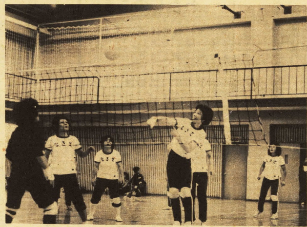
3会場で行われた婦人バレーボール

また、日頃の猛練習ぶりを発し、各試合とも好ゲームの連続でした。 なお成績は次のとおりです。 Aブロック優勝 ドリアンクラブ (新玉) 準優勝 足柄クラブ(足柄) Bブロック優勝 下曾我クラブ (下曾我) 準優勝 穴部(富水) 三位 高田(上府中) Cブロック優勝 千代(上府中) 準優勝 桜井(桜井) 三位 国府津小P(国府津)