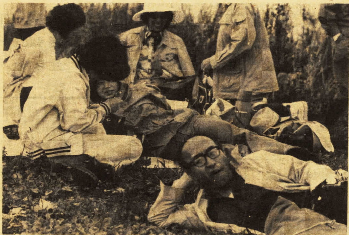
→多少つかれました