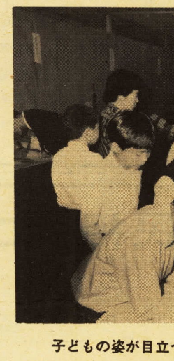
子どもの姿が目立つ展示場

市と教育委員会等の共催で、第二十四回児童生徒創意工夫展と科学展が十月十日から十二日(科学展は九日から十二日)まで市民会館で開かれ、連日小・中学生など多数の参観者でにぎわいました。出品点数は、創意工夫展が三百八十九点、科学展が三百五十九点で、廢物を巧みに利用し創意工夫意欲に満ちた作品、自然の観察記録や生物の生態、最近問題になっている地学(地震)を調査研究した作品が数多く展示されました。本市関係入賞は次のとおりですが、これら入賞作品のうち創意工夫展関係の二十点は、十一月二十五日から二十九日まで横浜ステーションビルで開かれる県主催の創意工夫展に出品されます。