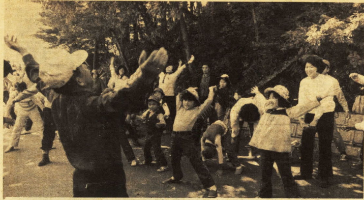
→歩く前に準備体操