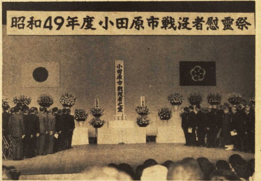
昭和49年度小田原市戦没者慰霊祭

や子供を安全な場所に寝かせていますか。6家のまわりにある燃えやすいものは整理されていますか。7たき火をするときは、消火バケツなどの準備をしていますか。8灯油などの危険物は安全な場所に保管していますか。9プロパンガスのボンベは傾けないように鎖などで固定してありますか。10家族で火災や地震のときどうするか話し合っていますか。11防火につきましても、どしどし消防署に御相談ください(電話(02)二五二一)