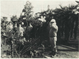
↑梅の種類(250種)では日本一といわれ見字が多い