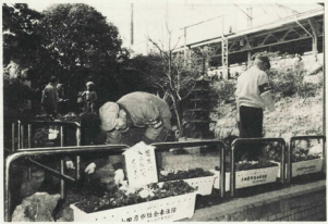
↑家内内を備えセンターの花下飾