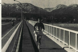
飯泉橋を力走する富士足柄の選手

昨年度は、富士足柄駅で開かれた。今年も、富士足柄駅で開かれた。今年も、富士足柄駅で開かれた。