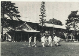
103歳をむかえた城内小学校

児童委員会は、毎朝朝礼の後、校庭を掃除し、校舎の美化活動を行います。また、毎朝朝礼の後には、児童委員会が中心となって、学校生活の改善や美化活動を行います。児童委員会は、毎朝朝礼の後、校庭を掃除し、校舎の美化活動を行います。また、毎朝朝礼の後には、児童委員会が中心となって、学校生活の改善や美化活動を行います。