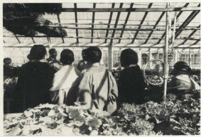
↑授業のはやまり。かり