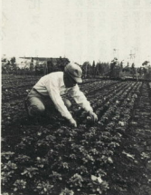
↑手塚にかけ(田)スミレ(おだわら町)

だが農田原の苗やセキタケは、(田)スミレを中心として、春の花の出回りがまじり、カネアザミ、土曜日などには、葉が連れられはじめ、カルセオリアやペチニアなどの咲きだされる道草で、「一年早い春を満喫する態もはばばつ。西高麗産の冬菜が、すれ、春を呼ぶ気配は中旬ころだろうか、自然の世界はもう一つ二つ衣替えしはじめた。