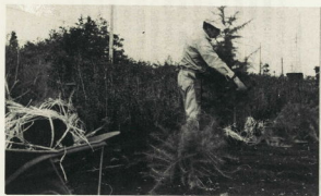
一種木の平入れも大切な管理作業