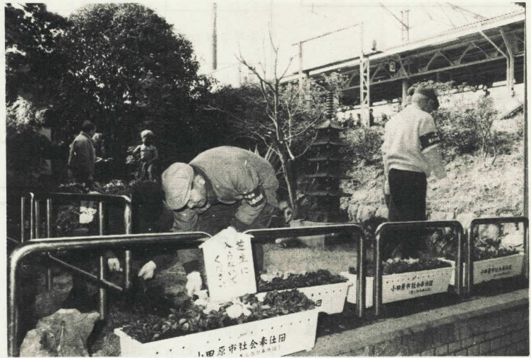
→ 駅構内を園芸センターの花で飾る