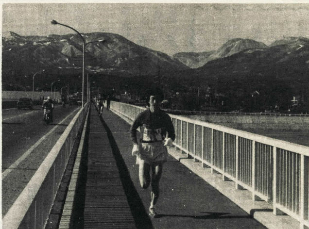
飯泉橋を力走する富士足柄の選手

本市駅伝の最後を飾る「実業団」対抗駅伝競走大会は、快晴に恵まれ、参加者で行列が伸びました。