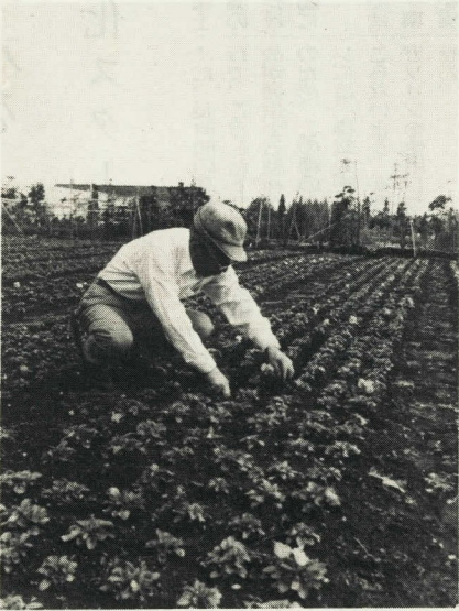
→ 手塩にかけた三色スマレをこれから町へ

だが諏訪原の園芸センターは、三色スマレを中心に、春物草花の出荷がまっさかり。土曜日などには、家族連れも訪れはじめ、カルセオラリアやベチニアなどの咲きみだれる温室で、一足早い春を満喫する姿もぼつぼつ。西高東低の冬型がくずれ、春を呼ぶ気圧配置は中旬ごろだろうが、自然の世界はもう一つ一つ衣替えをはじめた。