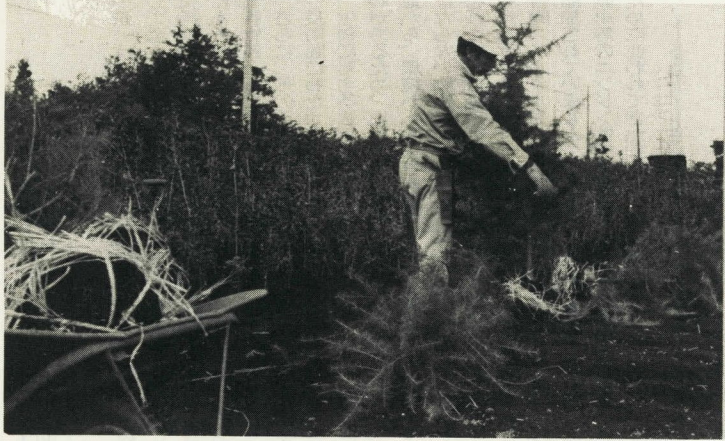
→ 植木の手入れも大切な管理作業