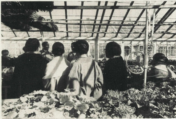
→ 温室の中は春がまっさかり