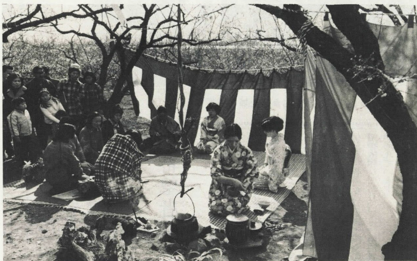
曾我別所梅林の野立て

一方、梅の名所曾我別所、中河原梅林では、曾我梅まつり実行委員会の主催により二月九日から三月一日まで俳句大会、短歌大会、撮影会、写生会、野だて、梅の苗木市、植木市、郷土芸能獅子舞