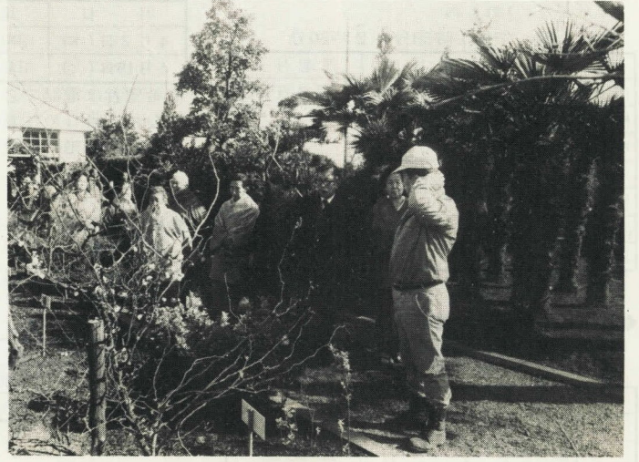
↑ 梅の種類(250種)では日本一といわれ見学が多い