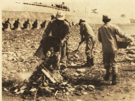
「海岸のゴミは燃してせら