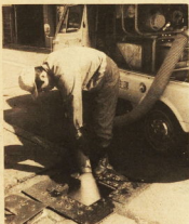
「マンホールなどは環境汚濁

しかし、市民はいかにしてもいい、そこで、家庭の周囲をみながらの手でできるところはみなさんの手で、と願うのが場からの方。