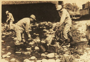
一川の下流は凹カンなどが多く