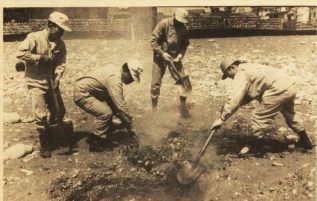
「一穴に埋める場合も