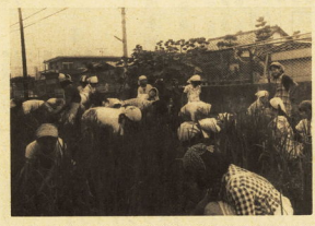
学校の行事の様子

本校は、児童会役員が中心となって、学校生活の改善に取り組んでいます。また、地域との連携も進めています。