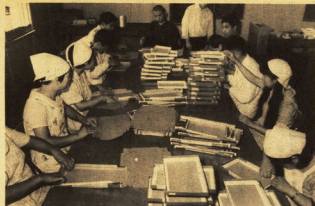
→共同作業の精づくり