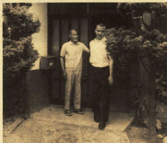
會通も大切な勉強のひとつ