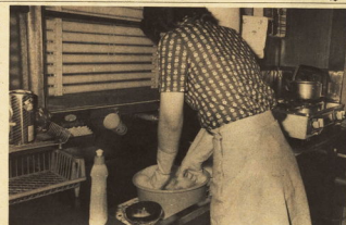
合成洗剤の適正使用を促す啓発活動の一環として、家庭用洗剤の適正使用を指導している。

合成洗剤の適正使用を促す啓発活動の一環として、家庭用洗剤の適正使用を指導している。合成洗剤は、洗浄力が高く、手荒れの原因となることがあります。適正な使用方法を守ることが、手荒れを予防する鍵となります。 適正な使用方法としては、洗剤の量を適切に調整し、十分にすすぎをすることが重要です。また、洗剤を直接肌に触れさせないように注意しましょう。 手荒れがひどい場合は、保湿剤を使用したり、皮膚科を受診したりすることも有効です。合成洗剤の適正使用を心がけ、清潔で健康的な生活を過ごしましょう。