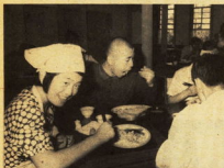
楽しい食事の時間