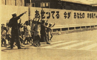
「子供の安全はなにもありません」