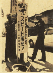
「曲がったりよこれたりしている車は車外に多い」