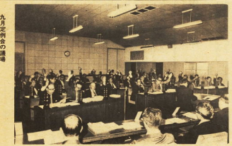
九月定例会の議場

本市は、九月の補正予算案を、十月五日(土)の朝、市議会に提出した。この補正予算案は、九月の補正予算案を、十月五日(土)の朝、市議会に提出した。この補正予算案は、九月の補正予算案を、十月五日(土)の朝、市議会に提出した。