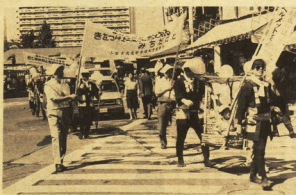
「二ゆっくりけいこう」と街頭PR