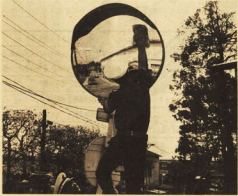
「もし安全確認ができなかったら」