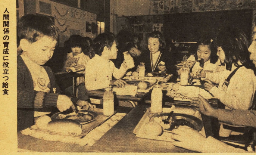
人間関係の育成に役立つ給食

しかし、経済の低成長下にあつて、不況とインフレという試練に直面した今日、多額の財政支出を伴う教育行政が、ややもすれば、「質の高い教育は、潤沢な財源の投入」という考えに陥りがちな、これまでのあり方から、「教育はどうあるべきか」という基本にたちもどつて、改めて問い直してみる時機にあるといえます。