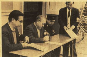
→三百三十灯の防犯灯に計画を提出