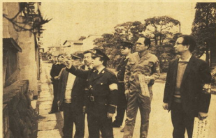
→パトロールをして狙われそうな場所を調べる