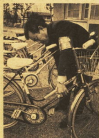
→自転車には名前をはりつけ

繁華街に近い住宅地は、空果などにおかれる率が高く、これらも届町地区はトップ。 そこで、これら招かざる地帯を警察と協力し、届町地区もみの活動は日ましくアンテナ調査をはじめ、模擬訓練、子供たちから募集した標識を看板の提出、自主パトロール、自転車等の記名運動など、効果的ありするところはなんでも実行。 この結果、一年たつたいま、大層な犯罪率の高さに軍配、一歩一歩、ドロボウを寄せつけず地域に軍配。