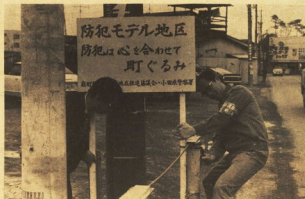
→防犯モデル地区の看板を立ててにらみをかす