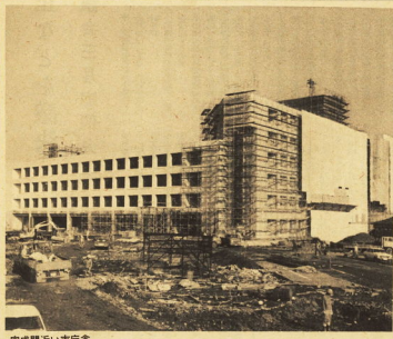
完成間近の市庁舎

極力事務を合理化 広域消防現像化も 極力事務を合理化し、広域消防現像化も進めています。極力事務を合理化し、広域消防現像化も進めています。