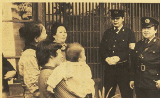
→空果の戸口などを隣近所で話し合