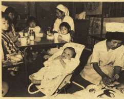
再開された小児病棟

昭和50年11月、市立病院の全病棟が閉鎖された。これは、当時の感染症対策の一環として行われた。その後、感染症の発生が減少し、病棟の再開が検討されるようになった。今年5月、小児病棟が再開された。これは、2年ぶりである。再開された小児病棟は、現在、小児科の病棟として機能している。病棟の再開は、患者の利便性を向上させ、医療の質を向上させることにつながる。また、病棟の再開は、医療従事者の負担を軽減することにもつながる。病棟の再開は、市民の健康を守るための重要な取り組みである。