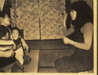
相談員に相あろう ご利用ください

市議会 四月の臨時会 市長の報告... (Text regarding the City Council meeting in April, including the Mayor's report and council decisions.)