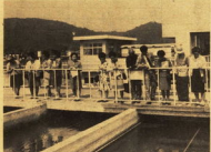
水道施設見学のご案内

水道施設見学のご案内 五月十九日(土) 午後二時～四時 五月二十日(日) 午後二時～四時 六月一日(水) 午後二時～四時 六月二日(木) 午後二時～四時 六月三日(金) 午後二時～四時 六月四日(土) 午後二時～四時 六月五日(日) 午後二時～四時 六月六日(月) 午後二時～四時 六月七日(火) 午後二時～四時 六月八日(水) 午後二時～四時 六月九日(木) 午後二時～四時 六月十日(金) 午後二時～四時 六月十一日(土) 午後二時～四時 六月十二日(日) 午後二時～四時 六月十三日(月) 午後二時～四時 六月十四日(火) 午後二時～四時 六月十五日(水) 午後二時～四時 六月十六日(木) 午後二時～四時 六月十七日(金) 午後二時～四時 六月十八日(土) 午後二時～四時 六月十九日(日) 午後二時～四時 六月二十日(月) 午後二時～四時 六月二十一日(火) 午後二時～四時 六月二十二日(水) 午後二時～四時 六月二十三日(木) 午後二時～四時 六月二十四日(金) 午後二時～四時 六月二十五日(土) 午後二時～四時 六月二十六日(日) 午後二時～四時 六月二十七日(月) 午後二時～四時 六月二十八日(火) 午後二時～四時 六月二十九日(水) 午後二時～四時 六月三十日(木) 午後二時～四時 六月三十一日(金) 午後二時～四時