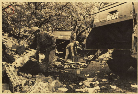
捨て方にもモラルを