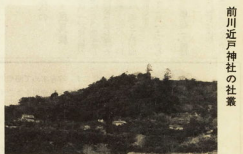
前川近戸神社の社堂

前川近戸神社の社堂は、新指定文化財として指定されました。社堂は、前川近戸神社の社堂です。