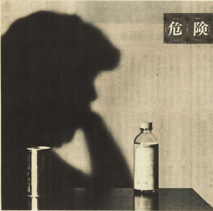
青少年をむしばむシンナー・ボンド乱用を防止しよう

今年に入ってから、シンナー・ボンドを乱用する者が激増し、関係者に大きな迷惑を与えています。数多くの少年非行の中で、なぜこの問題が大きく扱われるのでしょうか。それは、シンナー・ボンドの乱用と少年非行すべての面をつなぐているからです。一般「おれは特別なケース」と考えたくなるのが常だと思えます。しかし、この裏面から目を離してしまえば、子どもを危険の淵に突き落とすようなものなのです。