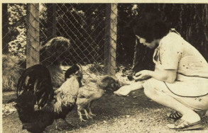
トリなどが現状を知らせることがある