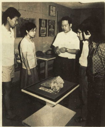
地震の知識を深めるため研究所を訪れる会員も多い