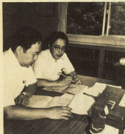
「なまず通信」には情報が読々と寄せられる