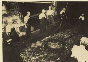
地震前にはいつも入る海洋魚などが大変に獲れることがある

県の温泉研究所を本拠とする「なまずの会」は、地震災害を助けるには、専門家だけでなく、一般の人たちにも地震に対する関心を持ってもらうことが大切と結成されたもの。 既に、山梨地震のときも予知情報がぞくぞく寄せられ、これからの活動には十分期待。 今では会員も百八十人増えなかなかの大盛況だが、データーの均衡を図るため、なお会員募集集中。