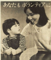
赤い羽根 福祉活動に参加しましょう