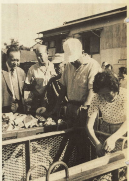
作業は朝7時から……市民もボランティアで活動

分別収集の実績は、5か月間の実績は119トンに達した。これは、分別収集の実施によるごみの減量の成果を示している。また、資源の再利用も進んでいる。分別収集された可燃物は、資源物として再利用され、不燃物は、焼却処理される。分別収集の実施により、ごみの減量は約119トンに達し、資源の再利用も進んでいる。 分別収集の実績は、5か月間の実績は119トンに達した。これは、分別収集の実施によるごみの減量の成果を示している。また、資源の再利用も進んでいる。分別収集された可燃物は、資源物として再利用され、不燃物は、焼却処理される。分別収集の実施により、ごみの減量は約119トンに達し、資源の再利用も進んでいる。