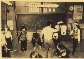
リハーサルにも熱が入る