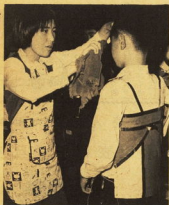
メーカーさんは女子の受け持ち

この文化祭、部活動や学習の成果などを発表する場とあわせて、全校生徒が参加し、学園あげての祭りとなる。