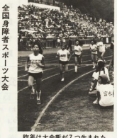
昨年は大会金が7つ生まれた

小田原市立体育少年部が、県青年大会で四競技に優勝。10月15日(土)開催。会場は、小田原市立体育館。