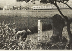
酒匂川のこの水で育てた少年金次第が、なげのしの秋で松苗をいれた地帯補植のために植えたのは、今は松東のサイクリングコースとして残されている。