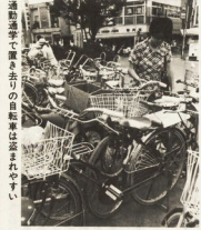
運動場で集めて、取り去りの自転車等は並べやすい