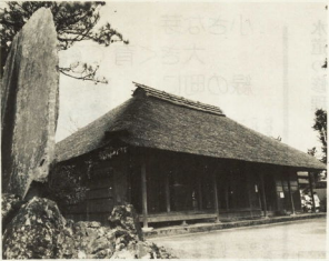
尊徳翁没後百年目の記念事業として復元保存された尊徳翁家は、江戸期の農家として貴重な資料となっている。