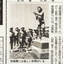
幼稚園には楽しい仲間がいる