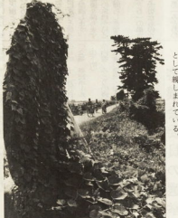
酒匂川のこの水で育てた少年金次第が、なげのしの秋で松苗をいれた地帯補植のために植えたのは、今は松東のサイクリングコースとして残されている。