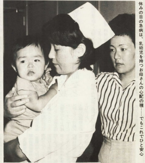
休みの日の急病は、乳幼児を構つてお母さんの心配の種……でもこれほど安心

市民生活の中心にも力をつくわられています。市民生活の中心にも力をつくわられています。市民生活の中心にも力をつくわられています。市民生活の中心にも力をつくわられています。 市民生活の中心にも力をつくわられています。市民生活の中心にも力をつくわられています。市民生活の中心にも力をつくわられています。市民生活の中心にも力をつくわられています。 市民生活の中心にも力をつくわられています。市民生活の中心にも力をつくわられています。市民生活の中心にも力をつくわられています。市民生活の中心にも力をつくわられています。