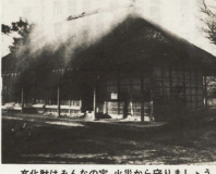
文化財はみんなの宝、火災から守りましょう

重要文化財 尊徳生家に防火設備 防火設備の設置 重要文化財 尊徳生家に防火設備 防火設備の設置