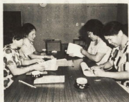
母親クラブの家庭調査は6月から