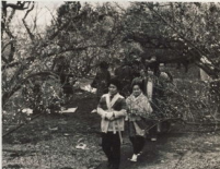
開花が進んで、今年も梅まつりが... 曾我の里に、城址公園ににぎやかだった梅まつり