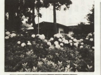
塔の峰青少年の家

スポーツの季節が... デニスを楽しむ日 スポーツの季節が... デニスを楽しむ日