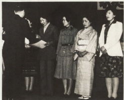
黒加草から撮影を受ける小田原の母親クラブ