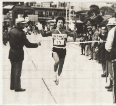
五連勝の輝きを帯びた富士フィルム足柄

富士フィルム足柄が五連勝 第1回小田原地区実業団駅伝大会 優勝(足柄)富士フィルム足柄 2位(足柄)小田原市立第一中学校 3位(足柄)小田原市立第二中学校 4位(足柄)小田原市立第三中学校 5位(足柄)小田原市立第四中学校